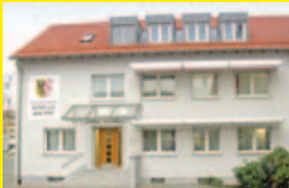
Geschäftsstelle, Herbartstr. 30